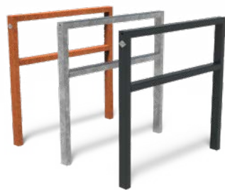
AROS 1S MET DUIKELSTANG