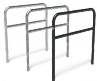
AROS 2S MET DUIKELSTANG